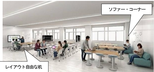
ラーニング・コモンズのイメージ