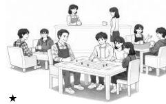
校内居場所カフェのイメージ

③ 他にも、学習支援員や学習支援ボランティア等、多様なスタッフが生徒を支援します。